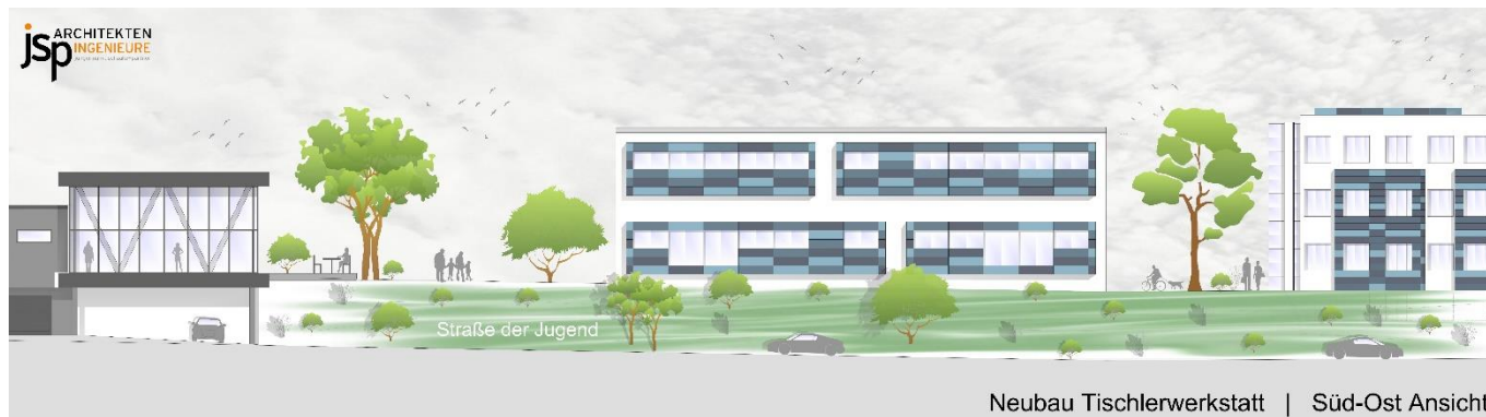
Neubau Tischlerwerkstatt | Süd-Ost Ansicht

Die Holzfachschule Bad Wildungen setzt ihre Modernisierungspläne fort: Nachdem das neue Internatsgebäude im vergangenen Jahr fertiggestellt werden konnte, wurden nun die Pläne zum Neubau der Tischlerwerkstätten auf dem Areal der Schule vorgestellt.